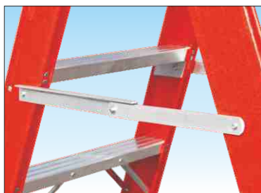
Barre distanziatrici di sicurezza anti-chiusura e anti-divaricamento ad apertura automatica in alluminio anti-ruggine