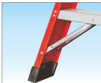
Base rinforzata con doppie nervature anti-urto realizzate in acciaio zincato