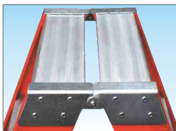
Cerniera in acciaio zincato con ripiano superiore dimensioni mm. 200 x 300