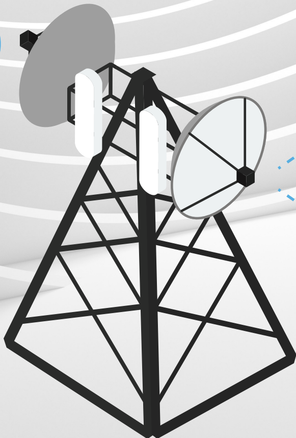
Stazione di Comunicazione 4G